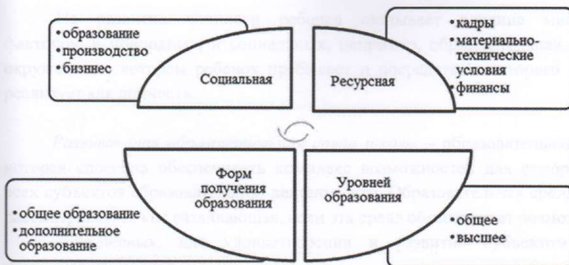
Рис. Модель комплексной интеграции

При этом, школа выйдет на качественно новый уровень образования (повысится социальная активность всех участников образовательного процесса, мотивация учащихся к изучению предметов естественнонаучного цикла, к научно-исследовательской деятельности). И в ВУЗ соответственно придет абитуриент, уже обладающий достаточно широким набором знаний и умений, позволяющим ему уже на младших курсах параллельно с учебой заниматься исследованием в научных лабораториях, что позволит студенту приобрести неоспоримые конкурентные преимущества к окончанию вуза, и в первую очередь будет интересен для работодателя.